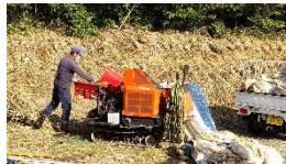
細かく切って 茶園に運ぶ