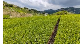
その結果、良質なお茶 が育っています