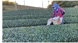
茶園の畝間に敷く