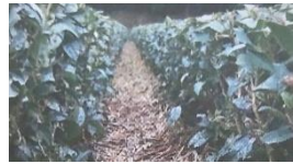
雑草・土壌流出防止 土壌保温・堆肥になる